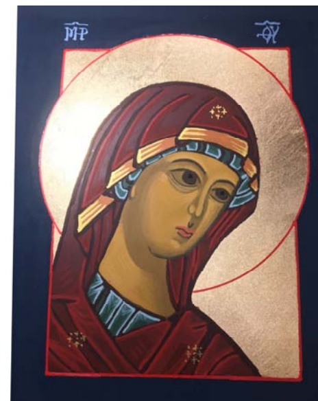
Ikone: © Ursula Zwingenberger